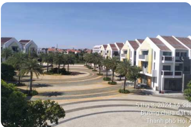
5 thg 8, 2024 14:33 Đường chưa đặt tên Thành phố Hội An